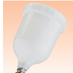
Fließbecher Bestell Nr. GFC-501