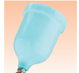
Fließbecher für schwierige Beschichtungsstoffe (Polyester blau) Bestell Nr. GFC-511